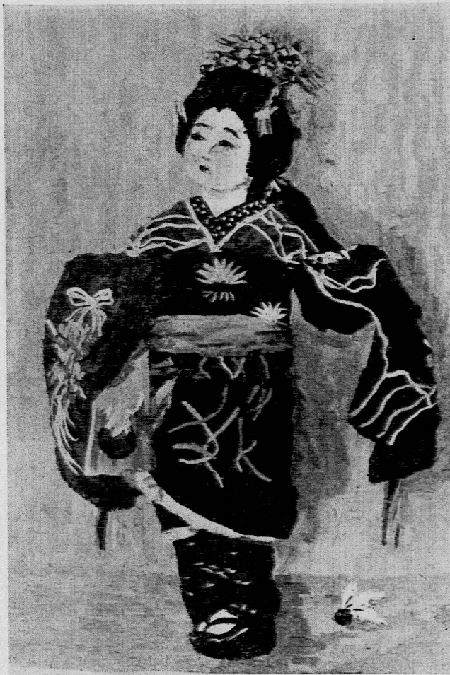
Aus kleinen Stoffresten angefertigtes Bildnis einer Japanerin. Geschenk aus Hiroshima.

Archivs der Schweizerischen permanenten Schulausstellung», der 1880 in den Titel «Schweizerisches Schularchiv» umgewandelt wurde. Seit jenen Anfängen wurde ein reiches, einzigartiges Material zusammengetragen. Es umfasst Verordnungen und Gesetze, Programme und Aufsätze, die das Schulwesen der ganzen Schweiz betreffen. Wir erachten es als unerlässlich, durch neue Bemühungen die Bestände zu ergänzen und auch die neueste Entwicklung zu erfassen. Das Schularchiv wird für wissenschaftliche Arbeiten, zur Dokumentation und — wegen der Vielgestaltigkeit der schweizerischen Schuleinrichtungen — zur Auskunftserteilung wertvolle Dienste leisten.