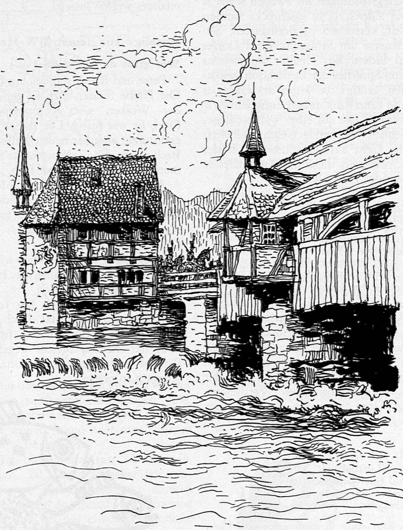
Illustration von Hugo Laubi aus SJW-Heft Nr. 583 «DIE FREIÄMTER DEPUTIERTEN UND GENERAL MASSENA»