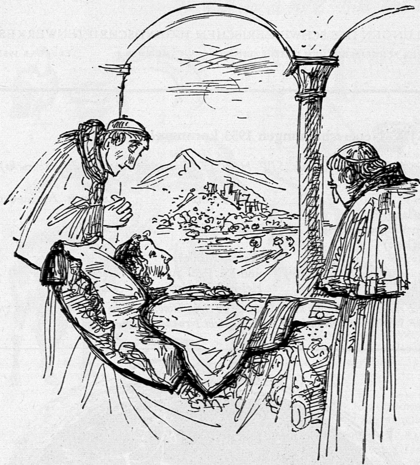
Aus: Das letzte Stündlein des Papstes Innocenz des Dritten

«Gehen wir jetzt», sagte Franz fröhlich, nachdem er ringsum weder einen Krüppel, noch ein Kind, noch ein Tierlein oder sonst was Bedürftiges sah, dem er etwas zulieb tun könnte.