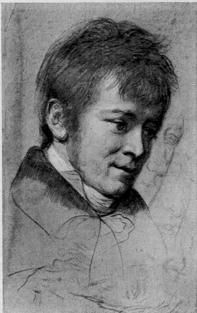
Anton Graff: Bildnis Heinrich Pestalozzis (?) (Kohle, weiss gehöht) Kunsthau Zürich (Inv. 1938/213)

(7.) Dass ich von Bürger Minister Stapfer mit heutigem Dato auf Rechnung der durch den Directorial-Beschluss vom 23. Julj 1799 mir zukommenden Sum empfangen drey Neue Louisdor, Bescheint den 6. Julj 1800 Pestalozzi. Vierzig und acht Franken.