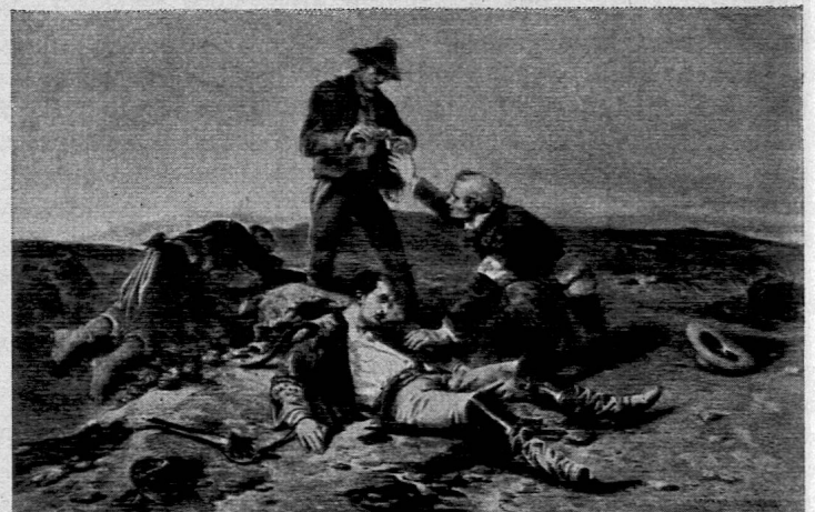
Der freiwillige Samariter auf dem Schlachtfeld

«Schutz und Pflege der Verwundeten», diese Forderung des Roten Kreuzes wird heute von den meisten Völkern als selbstverständliche Pflicht anerkannt. Doch welch gewaltige Opfer die Gründung des Roten Kreuzes brauchte, welch wunderbar göttliche Fügungen mitspielten, bis Henri Dunant seine Aufgabe erkannte und durchführen konnte, wird in diesem neuen SJW-Heft meisterlich erzählt.