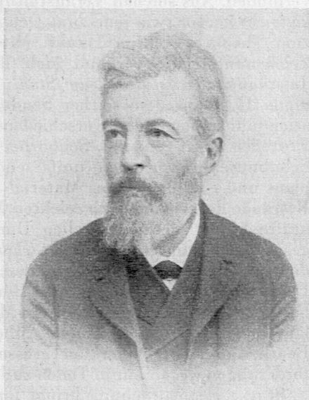
Otto Hunziker (1841–1909) Direktor des Pestalozzianums 1880–1904