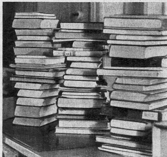
Zum Beginn des Tagewerkes im Pestalozzianum: Ausleihsendungen werden bereit gelegt.

Sicherlich liegt die Pflege solch internationaler Beziehungen im Interesse des Schweizervolkes. Dafür aber sollte der Bund die nötigen Mittel bereitstellen, statt die letzte kleine Subvention zu streichen. Es wäre im höchsten Grade bedauerlich und ein Unglück für unser Land, wenn im Bundeshaus nur noch die Machtansprüche der grossen Wirtschaftsverbände Beachtung finden würden, während stille Bildungsarbeit ohne jegliche Hilfe bleiben müsste.