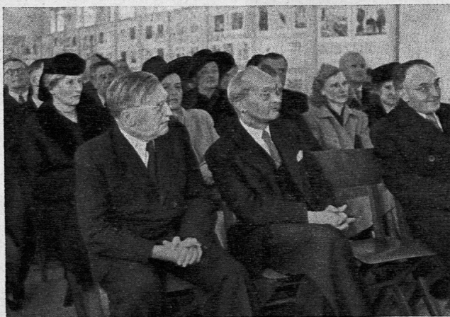
Eröffnung der Ausstellung «Neues Leben in den tschechoslowakischen Schulen».

Es zeigt sich bei solchen Ausstellungen immer wieder, dass sie besonderen Zuspruch finden, wenn sie nicht nur durch Führungen erläutert, sondern durch Vorträge, Lehrproben und Filme ergänzt werden. Im