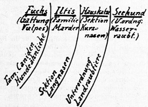
Tafel III. Einschiebung eines neuen Gliedes in die Tierreihe (Tafel II).

Den meisten unserer Leser sind ja diese Dinge bekannt, wenn auch vielleicht in anderem Zusammenhange. Wir dürfen darum, trotz der Kürze 1) , zu der uns der knappe hier verfügbare Raum zwingt, noch einen Schritt weitergehen. Der Lehrer muss ja stets sehr viel mehr Lehrstoff durchdenken, als er im Unterricht verwendet. Für den Schüler ist das mit Vorsicht Gebotene dann nicht mehr zu schwierig; die hier besprochenen Zusammenhänge werden sehr bald zum frohen Spiel.