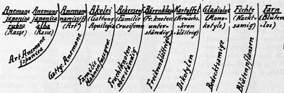
Tafel I. Pflanzenreihe

nicht aufmarschieren lassen (das ist eben immer der Nachteil der Zoologie gegenüber der Botanik als Schulfach). Es ist aber auch nicht nötig, denn die Schüler sind nun in der speziellen Tierkunde genügend bewandert. Wir brauchen nicht einmal die betreffenden Sammlungsobjekte nochmals vorzuweisen, eine «Visitkarte» mit dem Namen des betreffenden Tieres tut's auch. Ich habe eine ganze Anzahl solcher «Kartenspiele», botanische und zoologische. Je zwei oder drei Schüler erhalten ein Zigarettenschächtelchen, in dem ein solches Kartenspiel liegt, selbstverständlich alphabetisch oder gar nicht geordnet. Und nun habe ich immer meine Freude an dem Wetteifer, der sich da entwickelt. Man verlangt Zeitmessung und wird nicht müde, dieses «Täfelilegen» mit einem zweiten und dritten Kartenspiel zu wiederholen. Bei den Schülern hinterlassen diese Uebungen stets ein Gefühl der Befriedigung und der Sicherheit. — Die vorhin alphabetisch aufgeführten Tiere liefern die in Tafel II dargestellte Reihe.