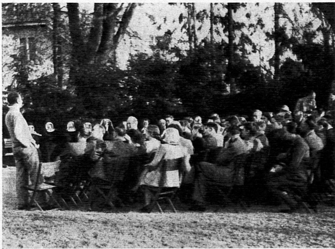
Aussprache anlässlich der Tagung für das Jugendtheater

nen und sie über den Wirkungskreis unseres Institutes zu orientieren.