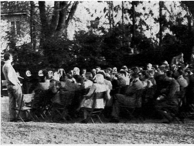
Aussprache anlässlich der Tagung für das Jugendtheater

nen und sie über den Wirkungskreis unseres Institutes zu orientieren.