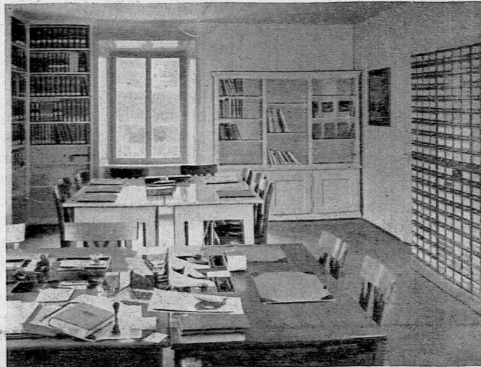
Der erweiterte Raum für Bücherausgabe und Kataloge.

Es sei hier gleich auf eine weitere Neuerung hingewiesen, die im Januar 1943 lebhaft begrüsst wurde: während der Heizferien in der städtischen Volksschule wurden im Saale des Neubaus die Bestände unserer Jugendbibliothek den Schulklassen zur Verfügung gehalten. Die Schüler kamen mit ihrem Klas-