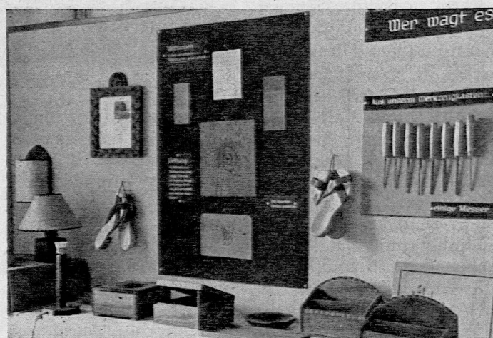
Aus der Ausstellung „Kopf und Hand“

Mag das so bleiben und zur festen Tradition werden!