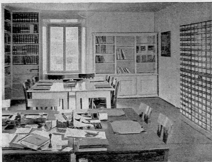
Der erweiterte Raum für Bücherausgabe und Kataloge.

Es sei hier gleich auf eine weitere Neuerung hingewiesen, die im Januar 1943 lebhaft begrüsst wurde: während der Heizferien in der städtischen Volksschule wurden im Saale des Neubaus die Bestände unserer Jugendbibliothek den Schulklassen zur Verfügung gehalten. Die Schüler kamen mit ihrem Klas-