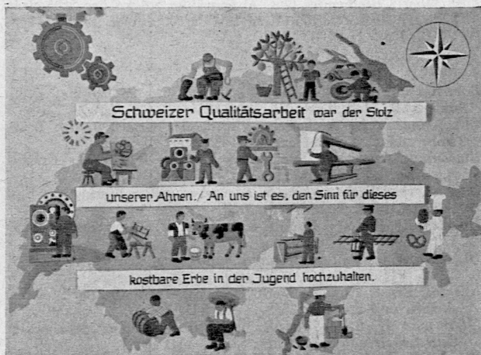
Aus der Ausstellung „Kopf und Hand“. Phot. A. Sigrist

Die Pestalozziforschung wird immer eine wesentliche Aufgabe unseres Instituts sein. Zwar hat der Krieg die Weiterführung der grossen kritischen Ausgabe der Werke Pestalozzis ausserordentlich gehemmt. Erst dieser Tage ist Band 18 zur Ausgabe gelangt, nachdem seit Einreichung des Manuskripts mehr als