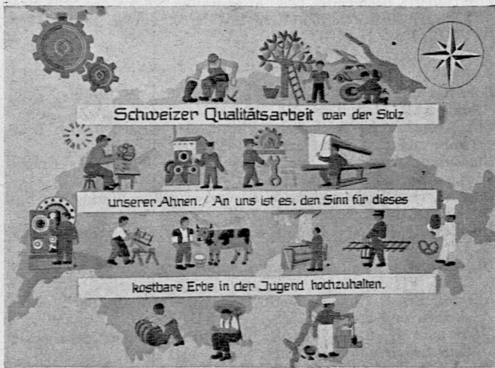
Aus der Ausstellung „Kopf und Hand“.

Die Pestalozziforschung wird immer eine wesentliche Aufgabe unseres Instituts sein. Zwar hat der Krieg die Weiterführung der grossen kritischen Ausgabe der Werke Pestalozzis ausserordentlich gehemmt. Erst dieser Tage ist Band 18 zur Ausgabe gelangt, nachdem seit Einreichung des Manuskripts mehr als