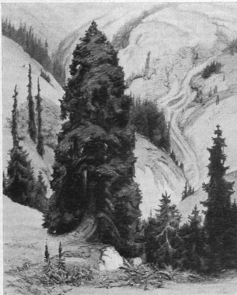
Karl Itchner: «Tanne am Abhang». Oelgemälde, im Besitze des Pestalozzianums, Zürich.

Schneller Versucher dess, was vor dir niemand versuchte — Schenke Gelingen dir Gott, und kröne dein Alter mit Ruhe! —