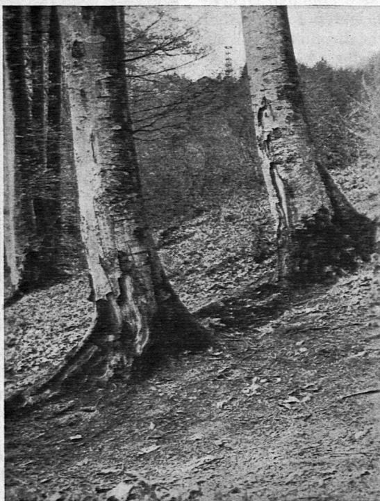
Brandschaden an alten Buchen auf dem Uetliberg. Zum Artikel «Der Wald im Lichtbild» auf Seite 18.

Diese begleitenden Erklärungen unterstützen nicht nur die sachlichen Vorbereitungen des Lehrers, sondern sie bieten auch die wertvolle Möglichkeit zu Schülervorträgen.