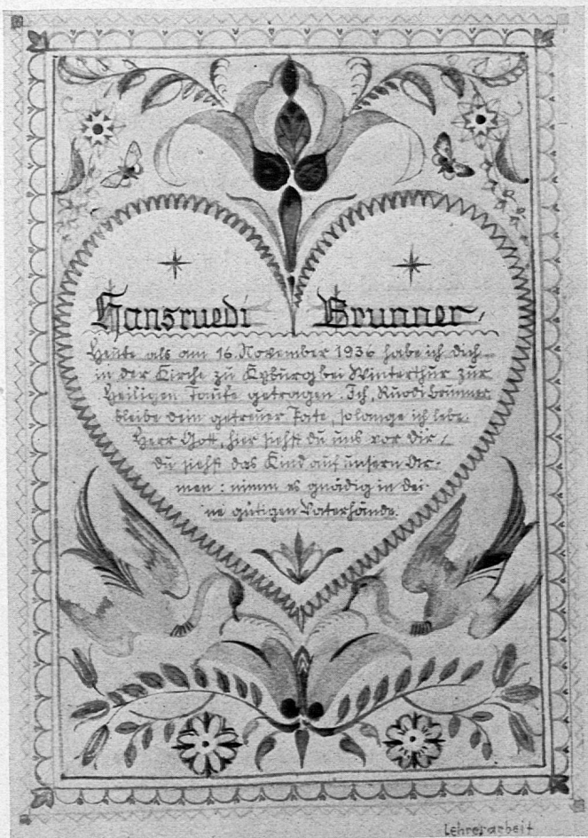
Götterbrief, Original 13×19 cm Lehrer: Rud. Brunner, Winterthur.