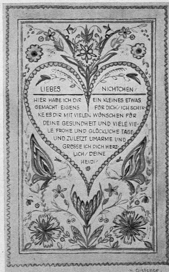
Götterbrief, Original 10×16 cm Schülerarbeit