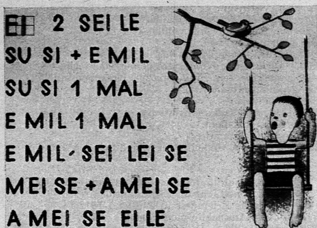
Aus der Basler Fibel

brechen und seine eigenen Wege zu gehen. Am Basler Lehrertag hat der Vorsteher des Basler Erziehungswesens der Vereinheitlichung der Lehrmittel das Wort geredet, und ein Jahr darauf legt er uns eine neue Basler Fibel vor. Die Frage, ob es eine Notwendigkeit war, eine eigene Basler Fibel zu schaffen, mag dahingestellt sein, namentlich in Anbetracht des Werkes, das entstanden ist. Was die Basler in der von Ulrich Graf verfaßten Fibel: Z' Basel an mym Rhy (drei Teile, Lehrmittelverlag des Erziehungsdepartementes) vorlegen, darf als eine Höchstleistung im schweizerischen Lehrmittelwesen angesehen werden. Die Fibel geht von einzelnen Lauten und Buchstaben aus und schreitet methodisch recht geschickt weiter, ohne sich einseitig einer bestimmten Methode zu verschreiben. Durch Zuhilfenahme von Bildern wird der Text anregend gestaltet, sodaß alles Langweilige und Sinnlose ausgeschaltet ist. Die einzelnen Lesestücke, von denen jedes in einer Lektion behandelt werden kann, bilden Stoffeinheiten und sind oft so gestaltet, daß auch sprachlich Gleichartiges wiederkehrt, wodurch der Schüler zum Lesen und Sprechen ermutigt wird. Der dem kindlichen Erlebniskreis entnommene Stoff nimmt Rücksicht auf den Lauf der Jahreszeiten und auf Feste wie Samichlaus, Weihnachten, Fasnacht und Ostern. Aus jeder Seite spricht fröhliches Leben, und nirgends hat man den Eindruck von Schulweisheit und Schulstubenluft.