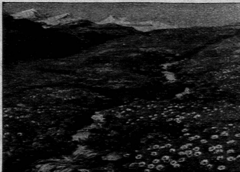
Grösse 300 x 210 mm und 400 x 300 mm