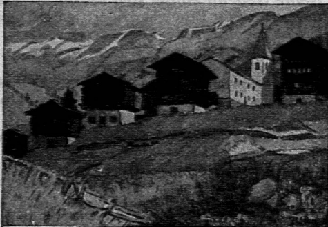
Grösse 252 x 180 mm

beim Bahnhof, am Wege von der Frutt, empfiehlt sich Vereinen und Schulen. Mässige Pensionspreise. Prospekte durch: Ida Fischer. 2818