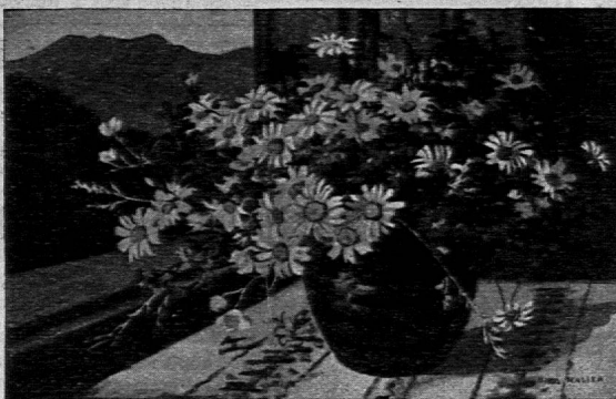
Grösse 265 x 195 mm

In einer Nummer des „SCHULBLATT“ für Aargau und Solothurn fand unsere