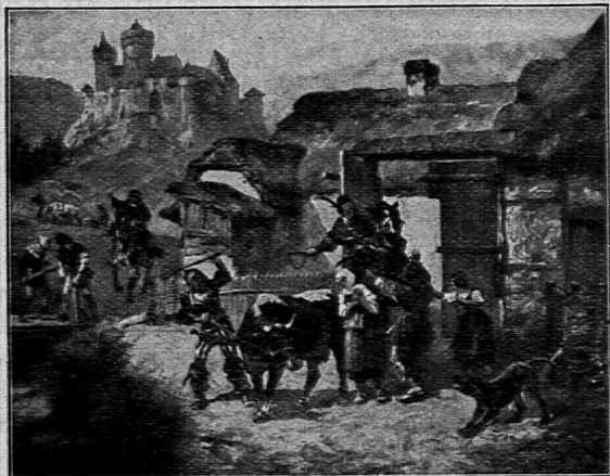
Wegnahme des Besthaupts

Das Bild stellt in einer bewegten Szene dar, wie aus einem Bauernhofe das „Besthaupt“ weggeholt wird. Ich kann mir denken, daß man die Schüler zunächst zu Beobachtern der Handlung werden läßt, um sie von da aus in die sozialen Verhältnisse jener Zeit hineinblicken zu lassen. So kann das Bild im Sinne der Arbeitsschule zum Ausgangspunkt einer kulturgeschichtlichen Betrachtung werden.