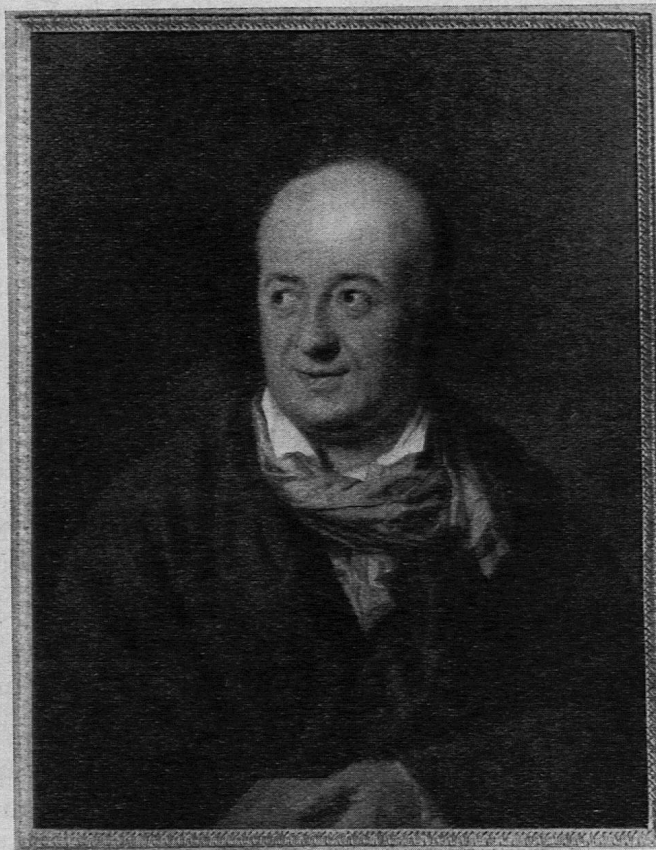
Salomon Geßner 1730–1788