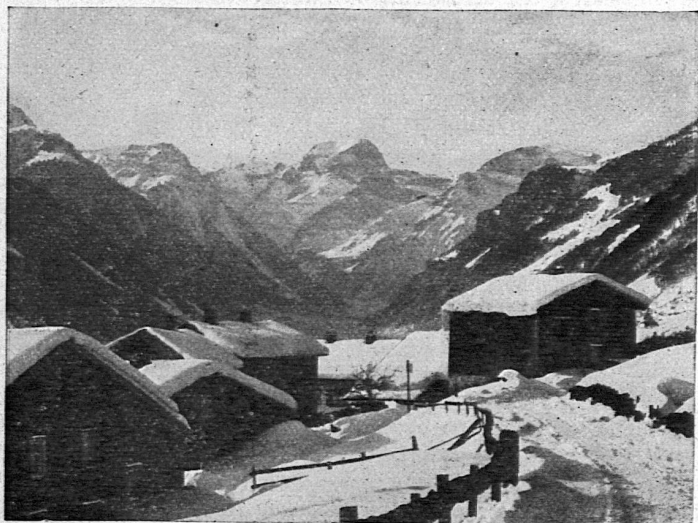
Die Tödigruppe von Schwändi aus gesehen.