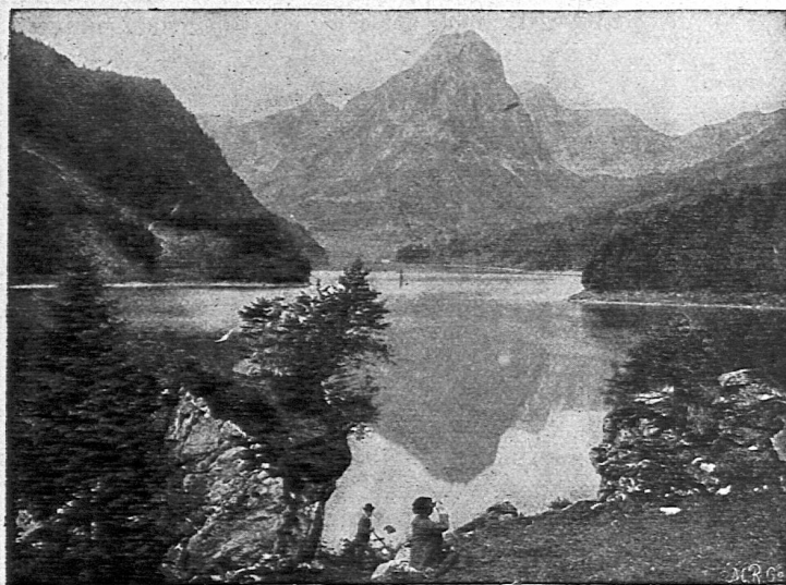
Obersee mit Brünnelistock.

Rhythmen klingen aber auch aus Talbildungen. Ober- und Untersand-Tierfeld; Mettmens-Kies-Schwanden; Spanneggsee-Talalpsee-Walensee; diese Stufenfolgen von Talböden sind landschaftsrhythmische Erscheinungen ebenso wie die Gensdarmen, die auf der Nordseite des Frohnalp-, Foo- und Gandstock Wache halten und sich mit einer Vorschlagsnote vergleichen lassen, die einen Klangrhythmus einleitet. Rhythmen lassen sich auch finden und empfinden im Aufleuchten des Lichts, dem «heiligen Crescendo der Natur», im Ersterben des Sonnengoldes, in den Farben und Formen der Wolken, in der Verteilung der Schneeflecken und der Gletscher, in der Waldbekleidung und alpinen Flora. Es umtönt uns in der Alpenwelt ein voller Chor von rhythmischen Erscheinungen als eine Ahnung von jenem erhabenen Rhythmus im All, der auf unserm Planeten den Wechsel der Jahreszeiten und damit tausend Rhythmen in Natur und Menschenleben wachruft.