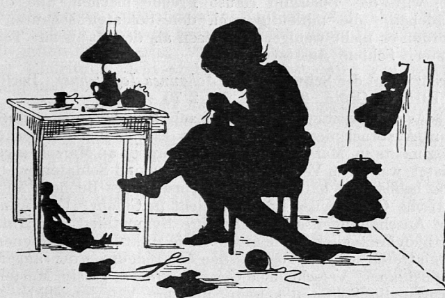
Aus „Freundliche Stimmen an Kinderherzen“.

Die sechs Erzählungen dieses Bandes offenbaren Lienerts Darstellungsgabe und Kenntnis seiner Landsleute aufs neue. Es brauchte eine geschickte Feder, um die kindliche Liebe des kleinen Anneli zu dem schwachsinnigen Balzli bis zum Kampf der gereiften Jungfrau gegen Eigennutz und Unrecht von Vater und Bräutigam zu steigern, wie dies in der ersten Erzählung geschieht, die dem Buch den Titel gegeben hat. Etwas von der ewig jungen List der Liebe gegenüber dem widerstrebenden Vaterwillen zeigt die Erzählung „Holüber“. Redlichkeit der Frau lässt den „Milchfälscher“ mit der Angst davon kommen; das ist köstlich erzählt. Von plastischer Wirkung ist die Erzählung von „Tönis Brautfahrt“ ins Welschland. Eine Kirchweih-Erfahrung spiegelt sich in der ergötzlichen Kindergeschichte: „Meine erste Liebe“, während „Klaudels Erbteil“ uns Schicksal und schliessliches Glück der treuen Katrina schildert. Was dem Buche den Reiz gibt, das ist die urwüchsige natürliche Art, wie Lienert seine Menschen gibt und reden lässt. Ungeschlachte Derbheit und gutmütiger Sinn, Härte und Eigennutz wie Treue und Hingebung lebt in diesen Naturen.