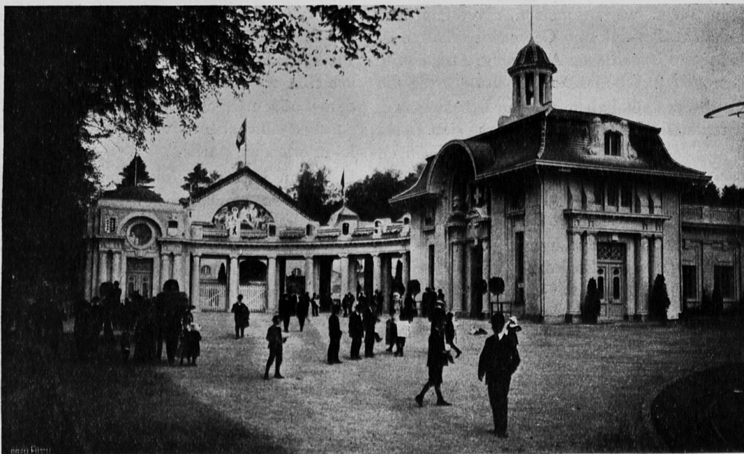
Schweizerische Landesausstellung in Bern. Der Haupteingang auf dem Neufeld.

Reformschulen par excellence sind sodann die Landerziehungsheime. Die Kollektivausstellung, die unsere vier schweizerischen Heime veranstaltet haben, macht der Arbeit, die sie leisten, alle Ehre. Grosse Aufmerksamkeit schenkt man zunächst der leiblichen Entwicklung der Zöglinge. Das beweisen die ausgestellten Kleidungsstücke, die Tabelle über regelmässige Körpermessungen und die Mitteilung einer der anwesenden Direktoren, dass man morgens regelmässig zwanzig Minuten turne. Wie lange wird es wohl noch dauern, bis man an öffentlichen Schulen die zwei oder drei ungeteilten wöchentlichen Turnstunden durch täg-