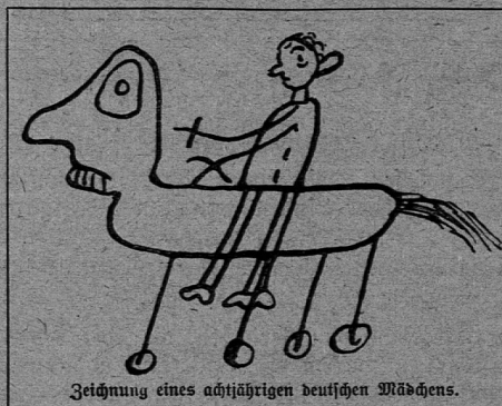
Zeichnung eines achttjährigen deutschen Mädchens.

Inhalt: Die Sinne. Der Verstand. Die Gefühle. Der Wille. Die Sprache. Die ästhetischen, moralischen und religiösen Vorstellungen. Psychopathisches im Kindesleben.