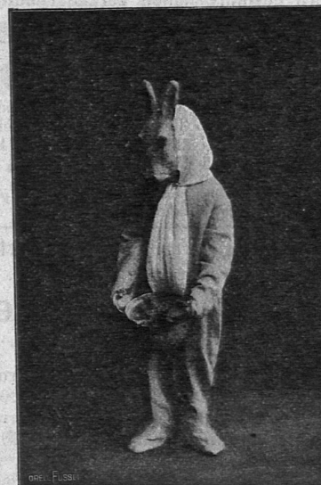
Hase Schnuppernase. Aus „Ein Küchenabenteuer“.

Verlag: Art. Institut Orell Füssli Zürich