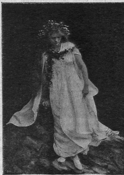
Das Märchen. Aus „Das Goldkrönlein“.

Kleines Lustspiel für 20 Kinder von 6—12 Jahren. (19 Seiten kl. 8° mit 1 Abbildung.) — .50