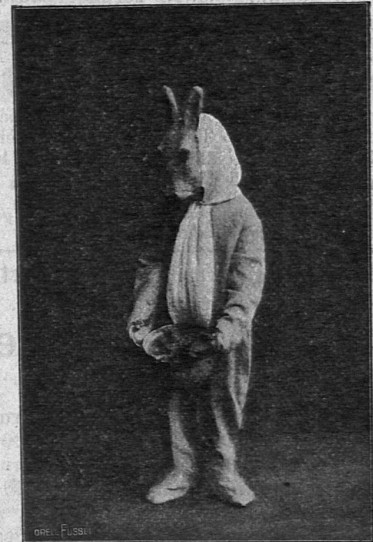
Hase Schnuppennase. Aus „Ein Küchenabenteurer“.

Märchenszene a. d. gleichnamigen 3-aktigen Märchenspiel. (31 Seiten, 8 o ) — .60 Klavierauszug dazu 3. —