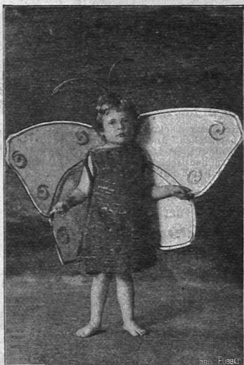
Der Schmetterling. Aus „Frühlings-Einzug“.

Märchenszene a. d. gleichnamigen 3-aktigen Märchenspiel. (31 Seiten, 8°) — .60 Klavierauszug dazu 3. —