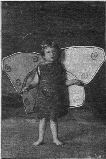
Der Schmetterling. Aus „Frühlings-Einzug“.

Frühlingsidyll in 2 Akten (40 Seiten, kl. 8 o mit 5 Abbildungen) — .60 Klavierauszug dazu 3. —