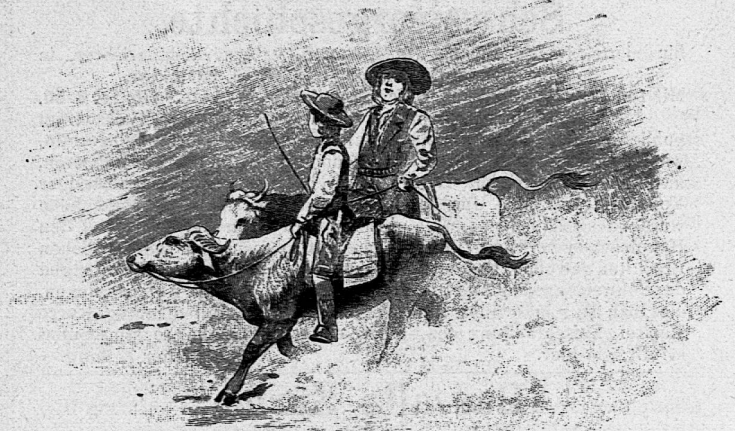
Illustration aus: „Der schweizerische Robinson“.

Die französische Ausgabe kostet broschiert 15 Fr.