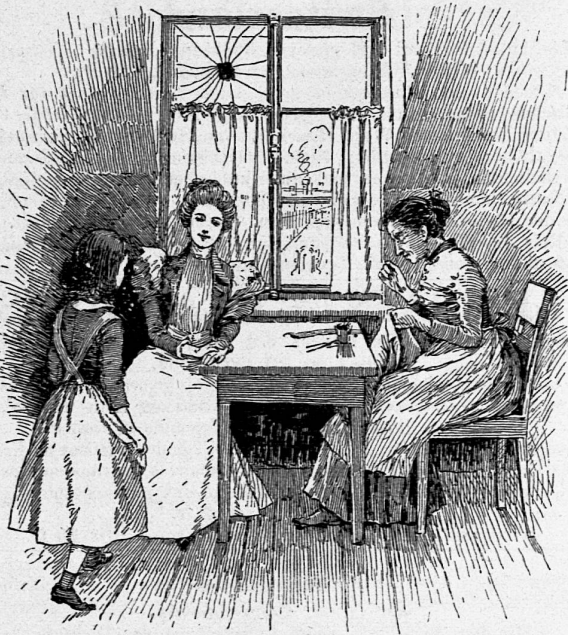
Illustration aus: „Im Schatten erblüht“.

VERLAG: ART. INSTITUT ORELL FÜSSLI, ZÜRICH.