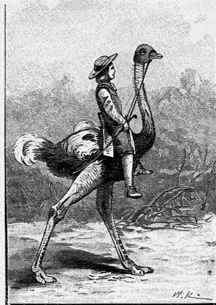
Illustration aus: „Der schweizerische Robinson“.

Von H. Frick-Lochmann. Dramatische und Deklamatorische Kleinigkeiten ersten und heitern Inhalts für den häuslichen Kreis. 1. Bändchen. Fr. 1. 50. ** Ein trefflicher Titel für ein nicht minder treffliches Büchlein, das mit seinem Inhalt dem Familien und Gesellschaftskreise kleine, leicht wiederzugebende Theaterstücke und Deklamationen zu angenehmer Unterhaltung an häuslichen Festen und gesellschaftlichen Anlässen bieten will.