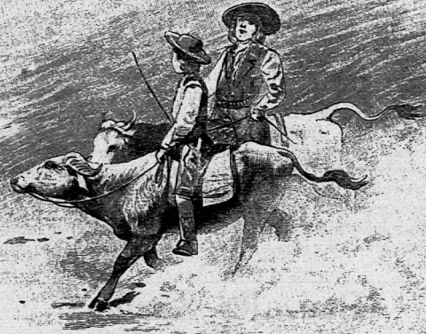
Illustration aus: „Der schweizerische Robinson“.

Die französische Ausgabe kostet broschiert 15 Fr.