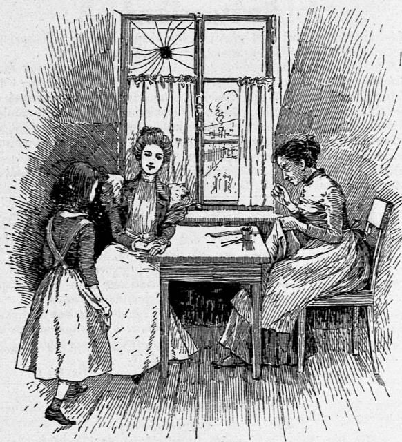
Illustration aus: „Im Schatten erblüht“.

VERLAG: ART. INSTITUT ORELL FÜSSLI, ZÜRICH.