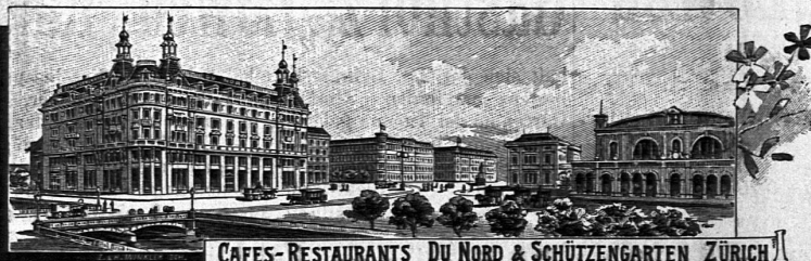
CAFES-RESTAURANTS DU NORD &amp; SCHÜTZENGARTEN ZÜRICH

für Deutsch (Literat., Geogr., Geschichte) u. Klavier, die auch Kenntnisse d. frz., engl. u. ital. Sprache besitzt, wünscht sich bis Herbst zu verändern. Offerten sub Z 0 4664 an Rudolf Mosse, Zürich. (Z 4233 e) [O V 407]