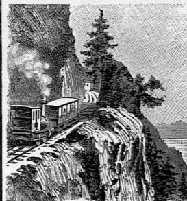
Kräbelwand Partie der Arth-Rigi-Bahn

Der schönste Ausflug für Schulen und Gesellschaften