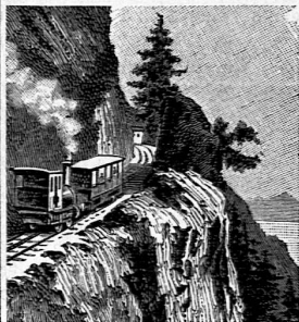
Krabelwand Partie der Arth-Rigi-Bahn