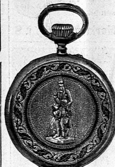
3/4 nat. Größe

Ein Professor der mod. Sprachen, seit 12 Jahren an einem Gymnasium in England tätig, sucht Stellvertretung in einem grösseren Institut, oder Übernahme eines Knaben- oder Mädchenpensionats.