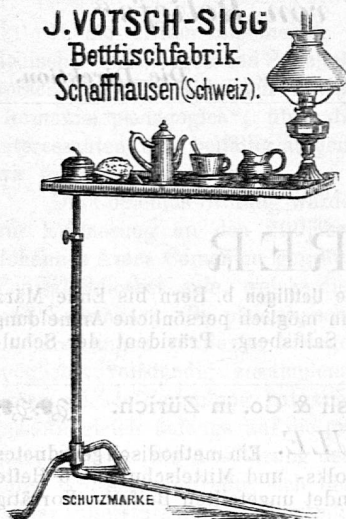
Prämirt in Teplitz 1884.

J. VOTSCH-SIGG Bettischfabrik Schaffhausen (Schweiz).