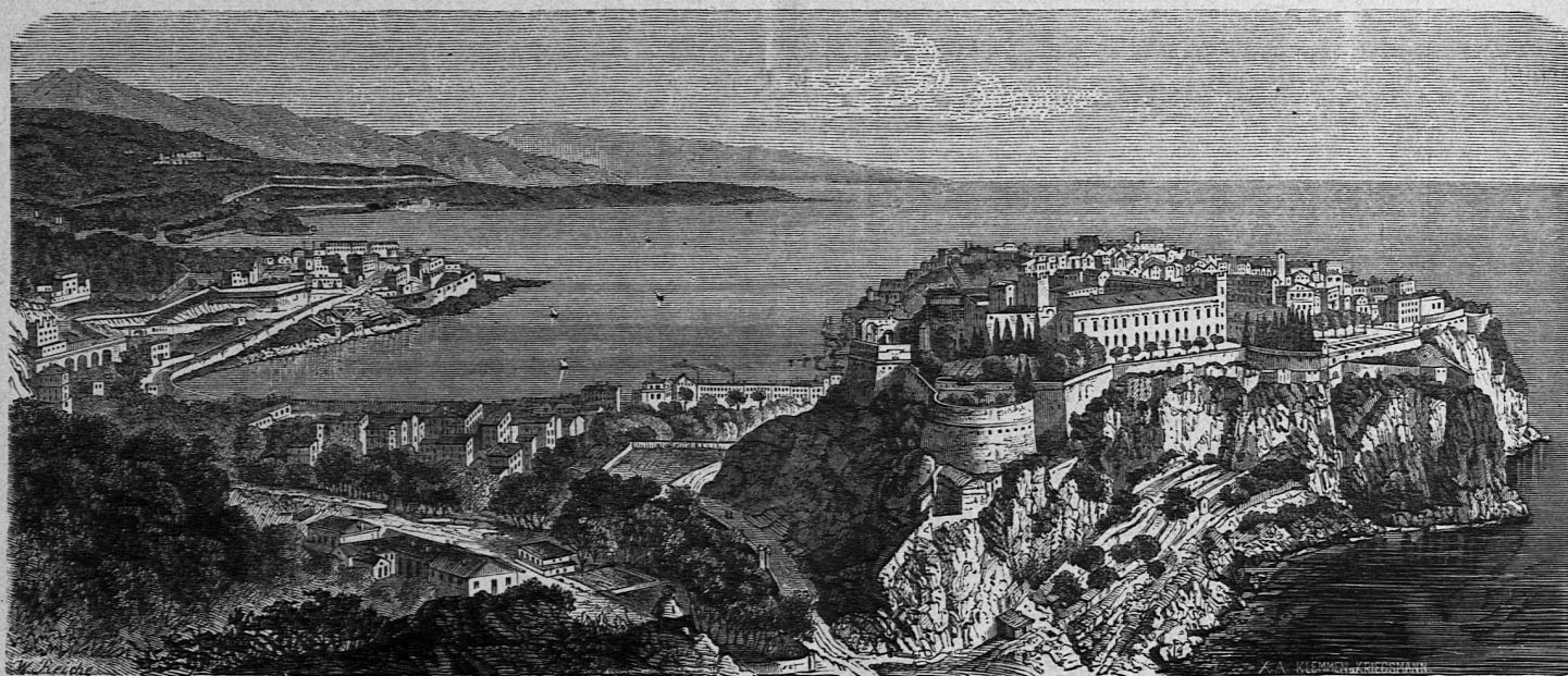
Monaco, Fürstenthum und Stadt.