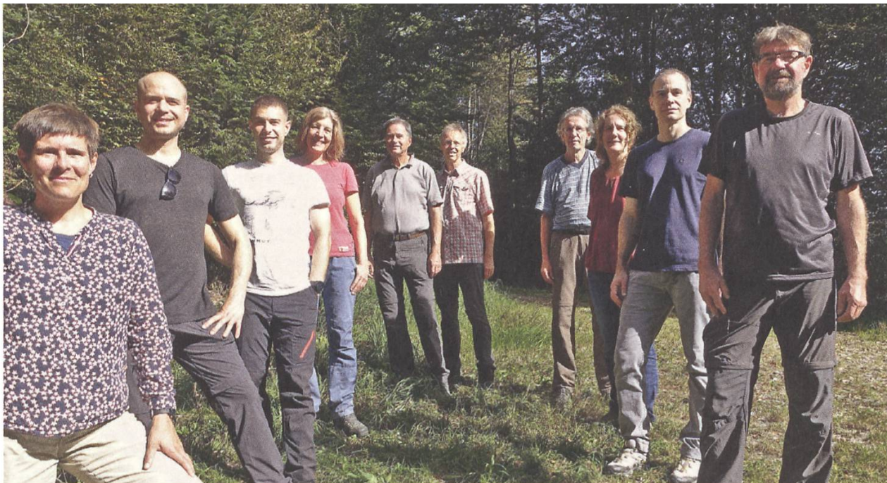
Das Team der SL-FP. L'équipe de la SL-FP.