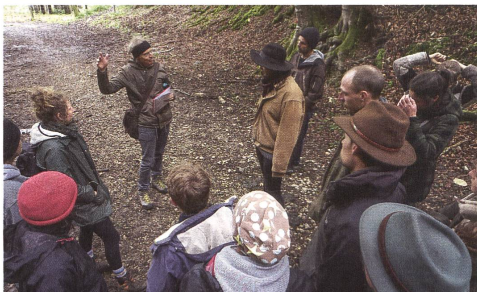
Kurstag mit Landwirtschaftsstudierenden im Schönthal

Die Bildungsarbeit und die wissenschaftlichen Tätigkeiten sind ein wichtiger Akzent der SL-FP. So findet die Themenliste für studentische Abschlussarbeiten regen Zuspruch und führt jährlich zu einem halben Dutzend betreuten Arbeiten. Darüber hinaus übernimmt die SL-FP auch eigene wissenschaftliche Studien, wovon einige im Jahr 2021 weitgehend abgeschlossen werden konnten: Neues Gemeinwerk, Quellen, Tranquillity Map. Schliesslich konnten im Jahr 2021 die Vorarbeiten für den neuen Ausbildungsgang der SL-FP «Ästhetische Landschaftsbewertung» ausgeführt werden. Dieser Kurs wird 2022 starten. Einen grossen Umfang nehmen inzwischen auch die Lehraufträge und Vorlesungen an den Hochschulen und Universitäten ein, die pandemiebedingt teilweise per Videokonferenz gehalten werden mussten. Der SL-FP-Geschäftsleiter führte 2021 die beiden Lehraufträge an der ETH Zürich (Master-Vorlesung «Landscape aesthetics»)