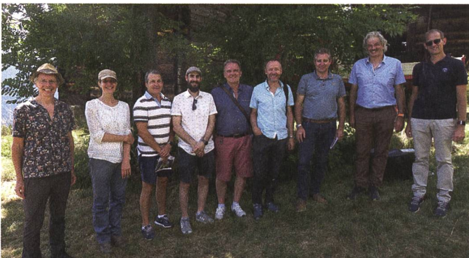
Gründungsversammlung «Fachkommission Bewässerungslandschaft Oberwalliser Sonnenberge»

Ernährungsgrundlage, Strukturvielfalt, Biodiversität, Ästhetik, Raum für Erholung: Bewässerungslandschaften leisten viel und verfügen über eine Vielzahl von Qualitäten. Gleichzeitig ist die traditionelle Bewässerung, wie sie in der Schweiz aktuell noch im Wallis (Wässerwasserleiten/Suonen und traditionelle Hangberieselung) oder im Oberaargau (Wässermatten) betrieben wird, auch ein Teil der regionalen Geschichte und Identität. Hinsichtlich des Ziels, traditionell bewässerte Regionen in der Schweiz, in Belgien, in den Niederlanden, in Deutschland, Luxemburg und Österreich für die repräsentative Liste des immateriellen Kulturerbes der Unesco vorzuschlagen, sind wir in der Schweiz einen Schritt weitergekommen: die Wässermatten Oberaargau und die Geteilschaften des Wallis sind bereits seit längerer Zeit auf der «Liste der lebendigen Traditionen in der Schweiz» aufgeführt, die Wässermattenstiftung existiert schon seit 1992,