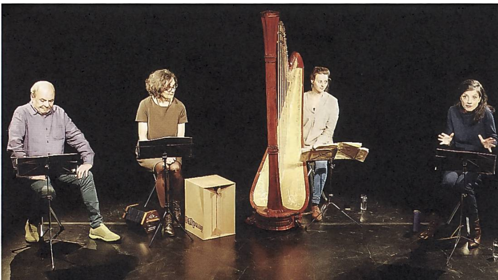
Arkadien auf der Theaterbühne – Impression von der Klibühni Chur