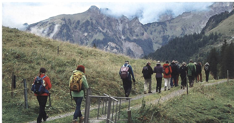
Exkursion auf der Alp Gitschenen in Isenthal UR