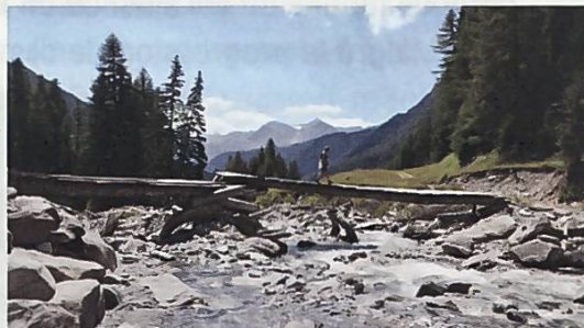
La fundaziun sustegna projects en l'entira Svizra, sco quai en l'Engiadina Bassa.

La Fundaziun svizra per la protecziun da la cuntrada ha l'onnn passà puspè sustegnì numerus projects en l'entira Svizra.