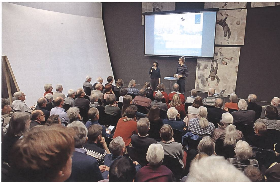
Voller Saal im Alpinen Museum dank Wildnisfilm

Als Schweizer Premiere wurde der Wildnisfilm «The New Wild» gezeigt, ein Dokumentarfilm, der auf ruhige und doch melodramatische Weise die Abwanderung von ganzen Tälern und ihre darauffolgende Verwilderung am Beispiel des italienischen Friauls aufzeigt. Der polarisierende Film löste denn auch eine Kontroverse über Verwilderung in der Schweiz und die entsprechenden Chancen im Umgang damit aus. Diese Themen wurden in der anschliessenden Podiumsdiskussion aufgenommen und diskutiert. Die Podiumsteilnehmenden, der SL-Geschäftsleiter