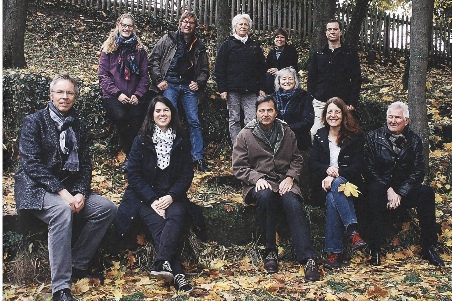
Das Team der SL. L'équipe du secrétariat de la FP.