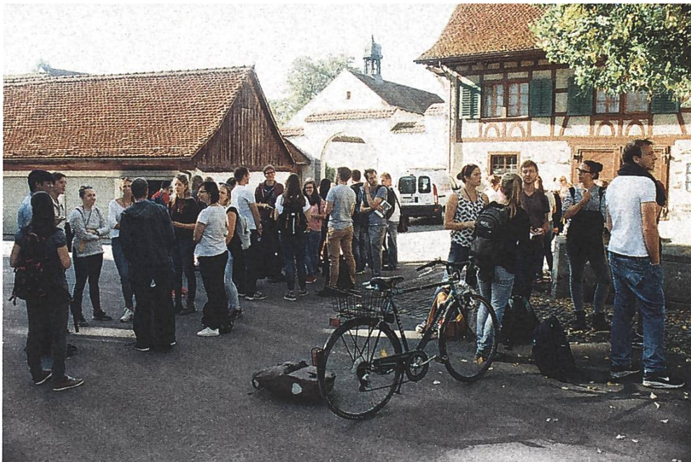
Exkursion mit ETH-Studierenden im Limmattal