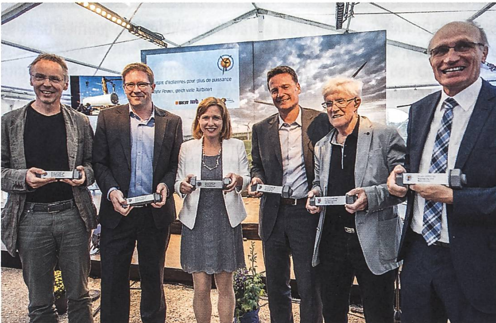
Medienfoto des Anlasses «20 Jahre Juvent SA» auf dem Mont Crosin