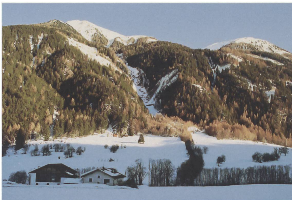
Blick von Müstair in Richtung Piz Chavalatsch und die Rifairer Alm GR (links im Bild)

Das Verbandsbeschwerderecht ist ein wesentliches Instrument für die gesetzeskonforme Anwendung der Normen des Umwelt-, Natur- und Landschaftsschutzes. Dabei ist immer zwischen der sogenannten latenten und der aktiven Wirkung des Beschwerderechtes der ideellen Organisationen zu unterscheiden. In ersterem Fall führt bereits die Tatsache, dass eine Einsprache oder Beschwerde erhoben werden könnte, zu einer qualitativ besseren Baueingabe beziehungsweise zu einer fundierteren Entscheidung. Dass dies aber nicht immer der Fall ist, zeigt die Bilanz der Beschwerdetätigkeit der SL.