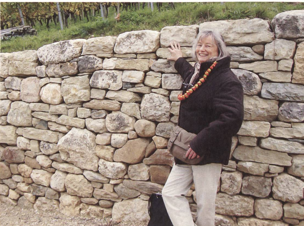
Diese Mauer hält sicher auch 40 Jahre!