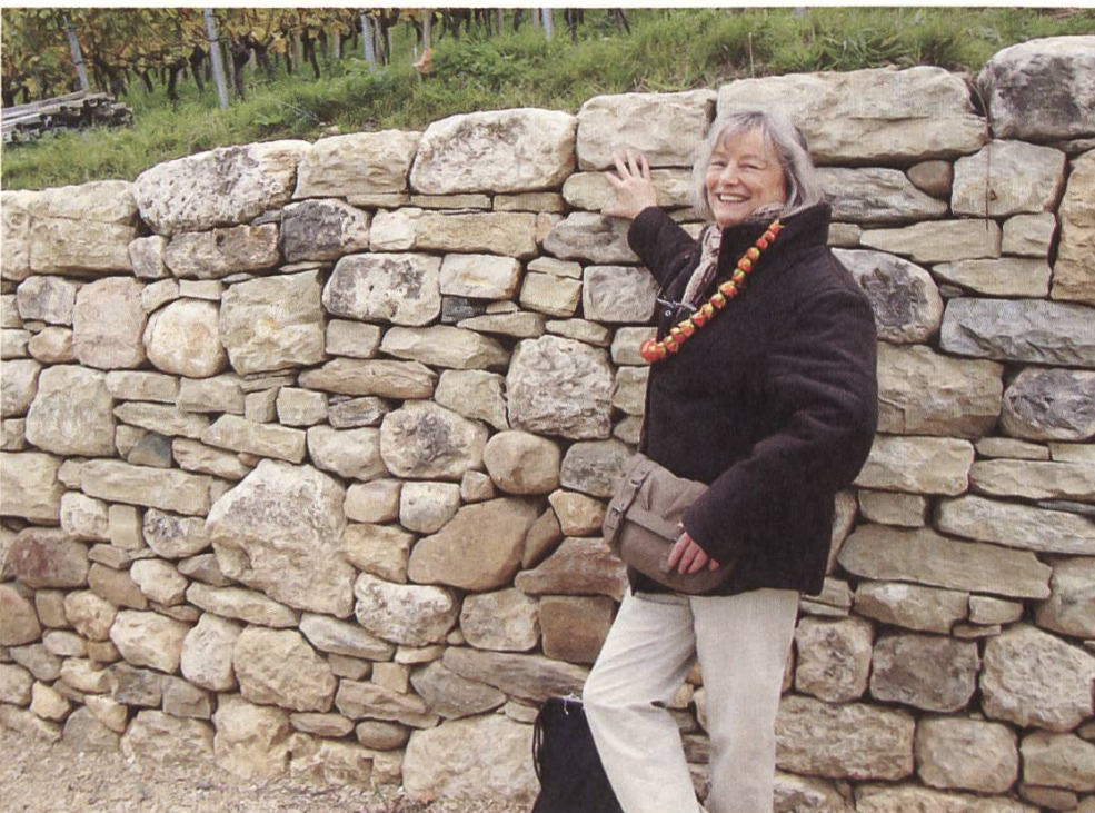
Diese Mauer hält sicher auch 40 Jahre!