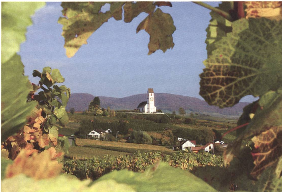
Geretteter Rebberg in Hallau SH dank SL-Beschwerde

Das Verbandsbeschwerderecht ist nach wie vor ein zentrales Instrument des Landschaftsschutzes. Dort, wo es um Natur- und Landschaftswerte geht, kann sich ausser den privaten Umweltverbänden kaum jemand wehren. Das Beschwerderecht gibt somit der Landschaft eine Stimme und verhilft dem gesetzlichen Schutzauftrag zur Durchsetzung. Das Verbandsbeschwerderecht wurde 2012 auch dank der Ratifizierung der Aarhus-Konvention gefestigt. Dank der raschen Handlungsweise der SL können daher immer wieder unnötige Eingriffe in die Landschaft mit einer Einsprache oder Beschwerde verhindert werden. Im Vordergrund stehen aber auch Projektverbesserungen, wie sie jüngst für die Skigebietsverbindung Andermatt–Sedrun erreicht wurden. Bereits sind auch unsere Stellungnahmen derart gewichtig, dass im Vorfeld einer Baupublikation oder Abstimmung entsprechende Erfolge für die Landschaft errungen werden können. So beispielsweise im Zusammenhang mit dem geplanten Golfplatz in Hausen am Albis ZH, mit dem Schneesportzentrum Parpan GR oder auch mit der Einzonung Waltramsberg St. Gallen.