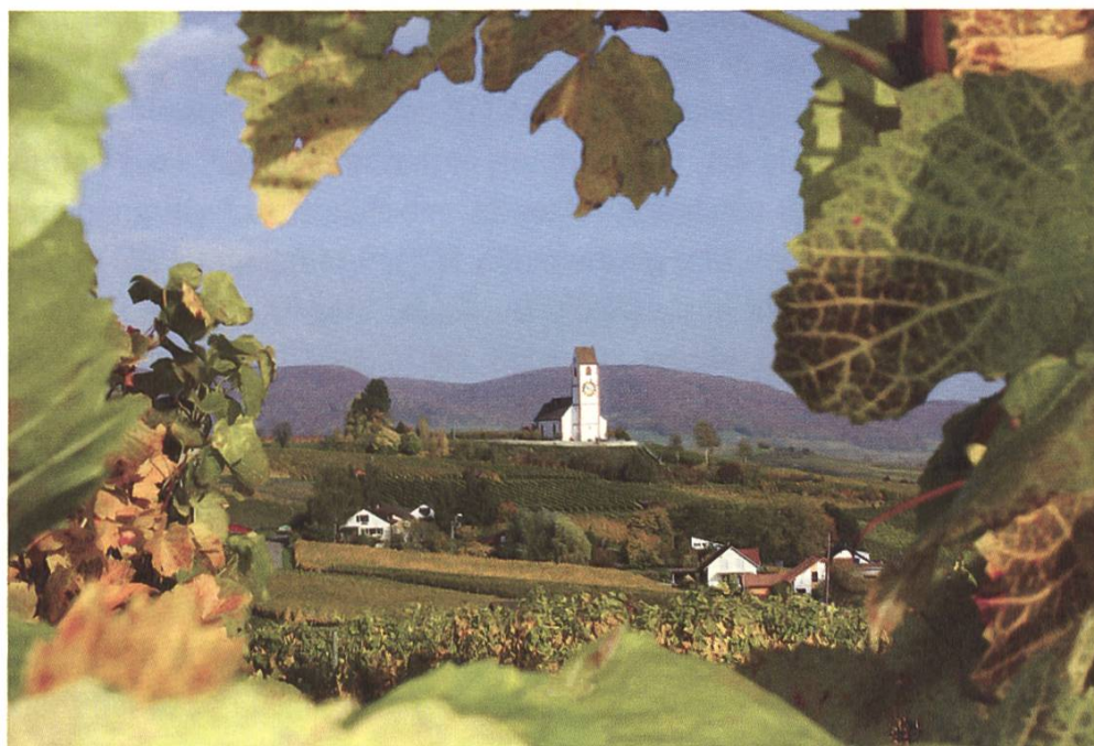
Geretteter Rebberg in Hallau SH dank SL-Beschwerde

Das Verbandsbeschwerderecht ist nach wie vor ein zentrales Instrument des Landschaftsschutzes. Dort, wo es um Natur- und Landschaftswerte geht, kann sich ausser den privaten Umweltverbänden kaum jemand wehren. Das Beschwerderecht gibt somit der Landschaft eine Stimme und verhilft dem gesetzlichen Schutzauftrag zur Durchsetzung. Das Verbandsbeschwerderecht wurde 2012 auch dank der Ratifizierung der Aarhus-Konvention gefestigt. Dank der raschen Handlungsweise der SL können daher immer wieder unnötige Eingriffe in die Landschaft mit einer Einsprache oder Beschwerde verhindert werden. Im Vordergrund stehen aber auch Projektverbesserungen, wie sie jüngst für die Skigebietsverbindung Andermatt–Sedrun erreicht wurden. Bereits sind auch unsere Stellungnahmen derart gewichtig, dass im Vorfeld einer Baupublikation oder Abstimmung entsprechende Erfolge für die Landschaft errungen werden können. So beispielsweise im Zusammenhang mit dem geplanten Golfplatz in Hausen am Albis ZH, mit dem Schneesportzentrum Parpan GR oder auch mit der Einzonung Waltramsberg St. Gallen.