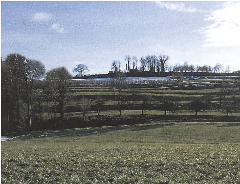
Intakte Terrassenflur am Buechebärg, Gemeinde Erlen TG

Durch den landwirtschaftlichen Fortschritt, die Siedlungsentwicklung und den Strassenbau sind heute viele Ackerterrassen verloren gegangen oder gefährdet. Um den Erhalt dieses eindrücklichen und wertvollen Kulturgutes besorgt, erarbeitete die SL in den letzten Jahren für den Thurgau eine kantonale Übersicht der Ackerterrassen – ein Novum in der Schweiz. So sollen die vielerorts in Vergessenheit geratenen Ackerterrassen wieder ins Bewusstsein der Bevölkerung gerufen und dem Kanton Thurgau ein Stück Geschichte und Identität zurückgeben werden.