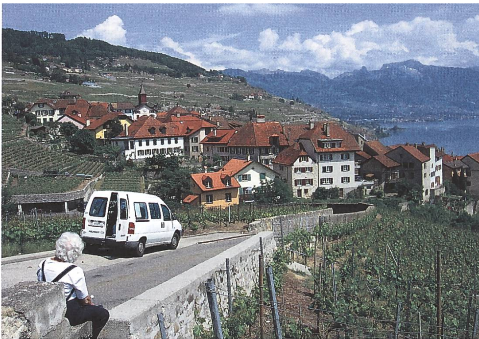
Exkursion der SL Ende Mai 2010 im Lavaux VD