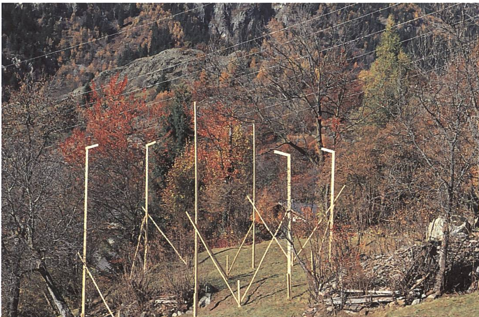
Neues Einfamilienhausquartier in Naters VS