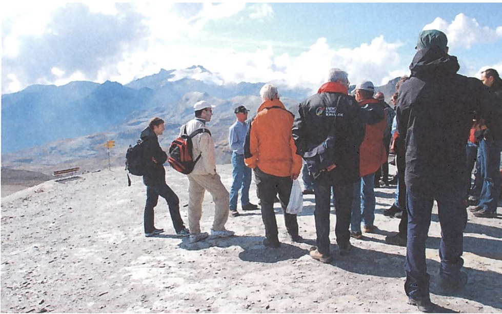
Exkursion zum Plaine-Morte-Glet- scher VS