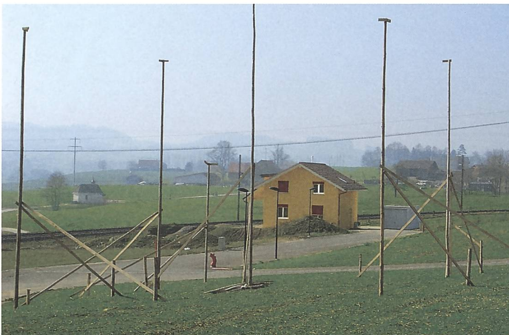
Die Zersiedelung schreitet fort (Beispiel Romont FR)

Die Chancen für eine griffige Raumplanung stehen gut. An zahlreichen Orten der Schweiz wird heftig über die Siedlungsentwicklung diskutiert und sehr häufig werden neue Bauzonen auch von der Bevölkerung abgelehnt. Die Schlagzeilen widerspiegeln dies entsprechend: «Im Appenzell wehrt man sich gegen den ‹Siedlungsbrei› («Südostschweiz»», «Wirkungslose Raumplanung» («Walliser Bote»», «Stimmvolk will keine Sonderzonen für Reiche» («Südostschweiz») u.a.