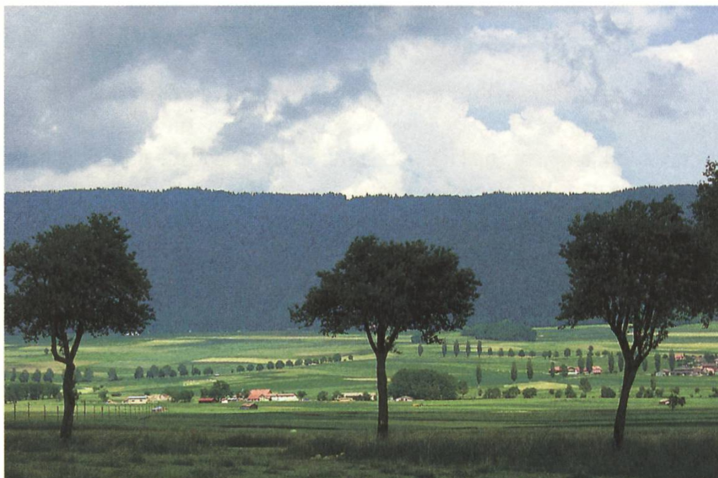
Alleenlandschaft Val-de-Ruz NE

Unter den verschiedenen politischen Vorstössen, welche die SL im Jahr 2008 über ihre Stiftungsräte und ihre guten Verbindungen zum Bundesparlament eingebracht hat, ist das Postulat vom 18. Dezember 2008 von Nationalrätin Adèle Thorens Goumaz (Mitglied des Stiftungsrates der SL) zum Schutz der Alleen und Baumreihen entlang von Strassen und Wegen besonders hervorzuheben. Mit 28 Mitunterzeichnerinnen und Mitunterzeichnern verschiedenster Parteien schlägt sie einen gesetzlichen Schutz von Alleen vor, die gerade auch dank der Kampagne des Fonds Landschaft Schweiz (FLS) nun da und dort wieder gepflanzt werden.