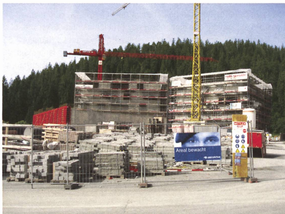
Beispiel Rockresort Laax GR