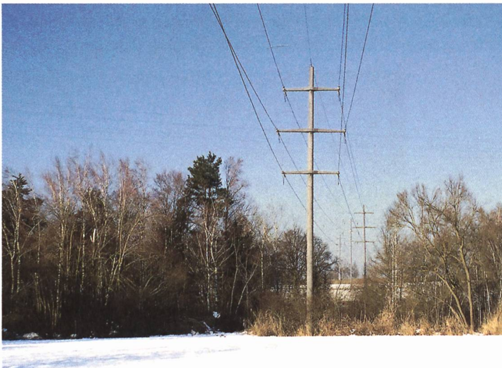
Freileitung in einem geschützten Flachmoor in Düdingen FR