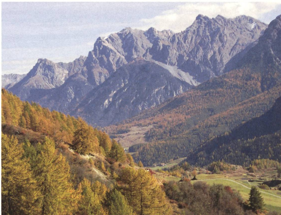
Unterengadin GR: Projektgebiet des Modellvorhabens «Inscunter»