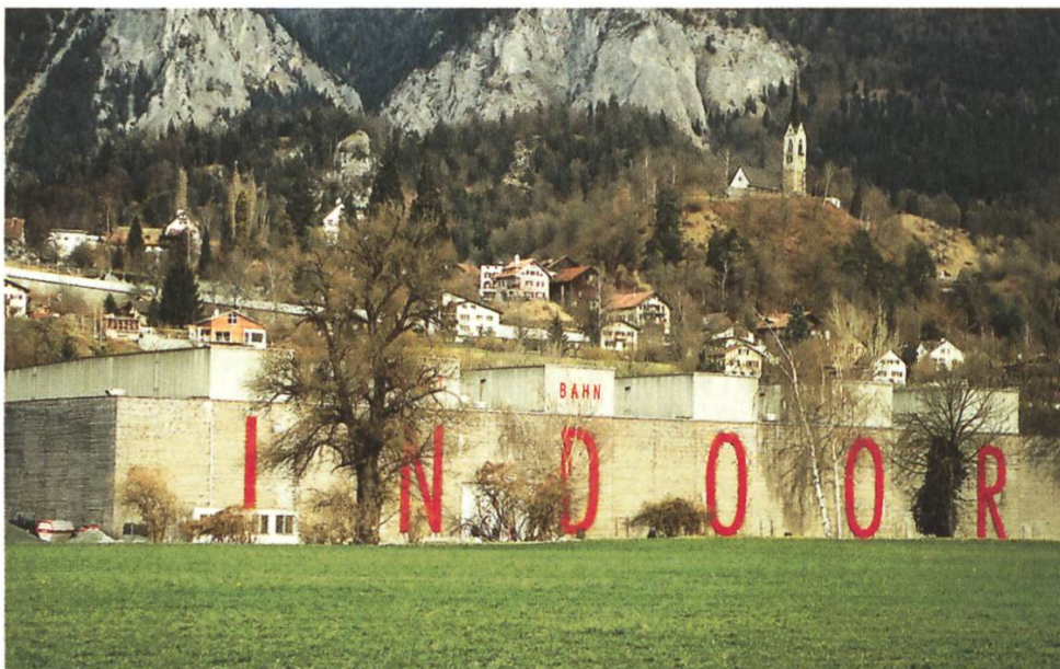
Das Bündner Rheintal unter grossem Baudruck