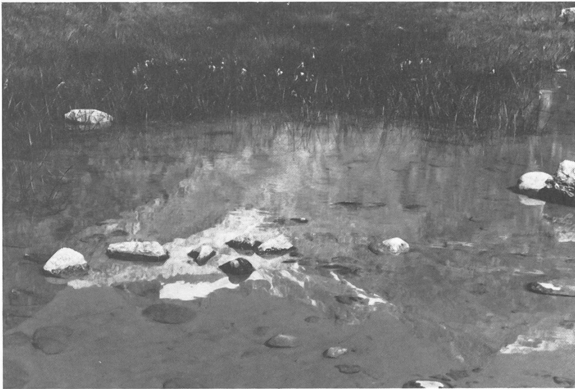
Sentier nature Gletsch