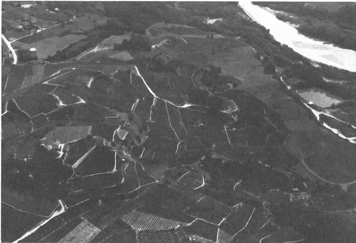
Salgesch / Salquenen