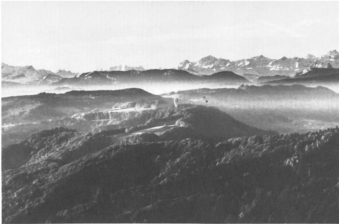
Höhronen, Albiskette, Wildspitz, Alpen, Blick vom Uetliberg. In der Mitte bestehendes PTT-Relais Felsenegg, rechts aussen ist eine weitere Station geplant.

Höhronen, chaine de l'Albis, Wildspitz et Alpes, vues de l'Uetliberg. Au centre, la tour relais PTT de Felsenegg. Une nouvelle et immense station PTT est projetée sur le Höhronen (à droite sur le photo).