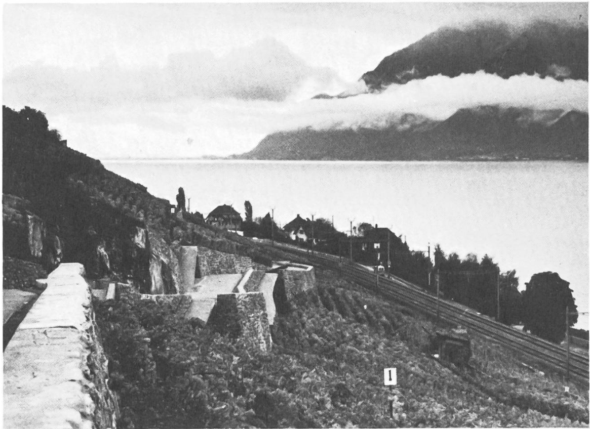
Der Landschaft gut angepasste neue Rebbergstrasse im Lavaux, La Villette (VD).

Améliorations foncières à Lavaux. La nouvelle route entre Villette et Cully, un exemple d'intégration au paysage.