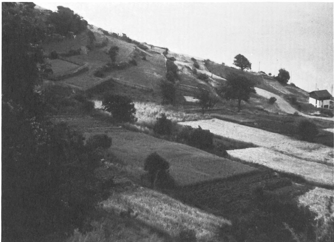
Bewirtschaftete Ackerterrassen in Erschmatt (VS).

Améliorations foncières à Lavaux. La nouvelle route entre Villette et Cully, un exemple d'intégration au paysage.