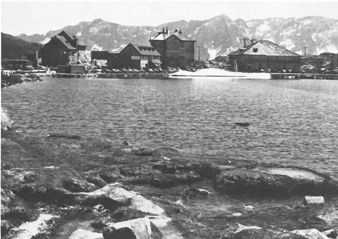
Das Gotthard Hospiz, Landschaft von nationaler Bedeutung. Hier plant die SBB eine neue elektrische Freileitung.

Höhronen, chaine de l'Albis, Wildspitz et Alpes, vues de l'Uetliberg. Au centre, la tour relais PTT de Felsenegg. Une nouvelle et immense station PTT est projetée sur le Höhronen (à droite sur le photo).