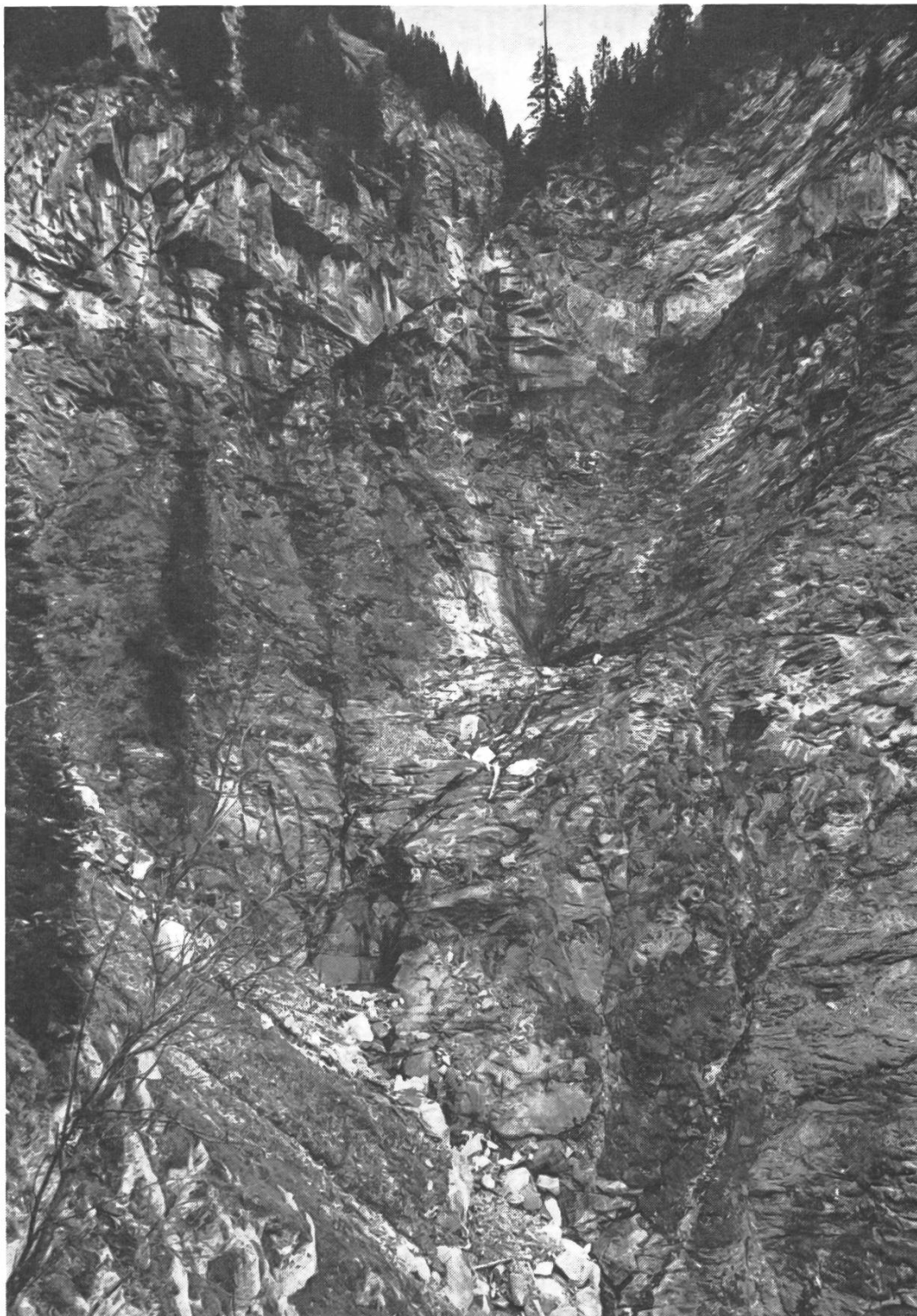
Le "Scheubsbach" (Weisstannental SG) avant et après son utilisation par les forces motrices de Sarganserland. La carte postale représentant l'image de gauche est encore en vente.