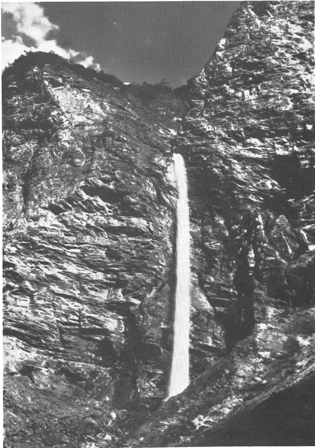
Scheubsbach im Weisstannental (SG) vor und nach dem Bau der Kraftwerke Sarganserland. Das Bild links ist als Ansichtskarte immer noch erhältlich.