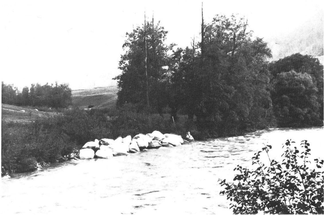
Vorbildliche Lösung: Beschränkung auf das notwendige Minimum, Sanierung einer Anrissstelle mittels Blockwurf. Flachufer und Ufervegetation bleiben erhalten. Rotten bei Münster (VS)

Cette solution de remédier à une érosion ponctuelle de la rive au moyen de blocs de pierre ne détruit au moins pas l'ensemble de la rive et de sa végétation. Le Rhône près de Münster (VS)