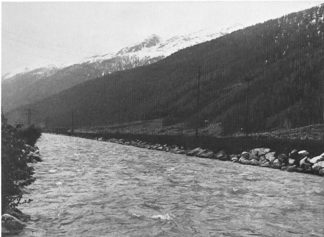
Zerstörung einer naturnahen Flusslandschaft: Verbauung mit durchgehendem Trapezprofil. Der lebendige Fluss wird zum monotonen Kanal. Rotten bei Oberwald (VS)

Cette solution de remédier à une érosion ponctuelle de la rive au moyen de blocs de pierre ne détruit au moins pas l'ensemble de la rive et de sa végétation. Le Rhône près de Münster (VS)