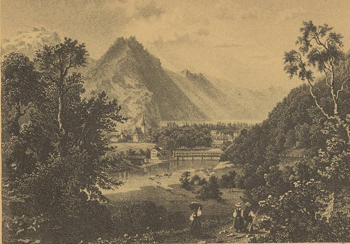
Aarelandschaft bei Interlaken nach einem alten Stich.

Paysage des bords de l'Aar d'après une ancienne illustration.