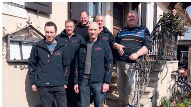
Der Vorstand der Sektion Jura/Berner Jura (ohne Präsident Christian Heusler), eingekleidet mit den neu angeschafften Jacken.

Im Rahmen einer ausgedehnten Diskussion rund um den landwirtschaftlichen Strassenverkehr (Bremsen, Unterschiede zwischen 30- und 40-km/h-Anhänger) wurde darauf hingewiesen, dass man den jungen Traktorfahrern bei den «G40»-Kursen vermehrt die Themen Sicherheit und Aufmerksamkeit vermitteln sollte. Zu oft stelle man fest, dass während der Fahrt elektronische Geräte wie Smartphones und andere bedient würden, was zu gefährlichen Situationen führen könne. Zunehmendes Gefahrenpotenzial ortete man auch im Zusammenhang mit Zweirad-Fahrern, da diese zunehmend auf Flurstrassen unterwegs sind. In seinem Grusswort ging SVLT-Vizepräsident Bernard Nicod auf diese Problematik ein und wies ergänzend darauf hin, dass Landmaschinen wegen neu eingebauter Schikanen gewohnte Routen häufig nicht mehr befahren können. Er forderte die Anwesenden auf, hier wachsam zu bleiben und rechtzeitig bei solchen Bauvorhaben zu intervenieren. ■